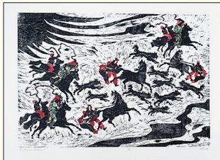
Die Hunnen Kommen, Holzschnitt, 65 cm x 85 cm, 2017