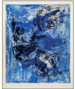
O.T., E.A. Lithografie und Radierung, 50 cm x 70 cm, 2018

Zahlreiche Einzel- und Gruppenausstellungen seit 1980 in Wien, Salzburg, Linz / Österreich, Basel / Schweiz, Halle a.d. Saale, Berlin, Quedlinburg, Mannheim / Deutschland, Nagoya, Kyoto, Kurashiki / Japan, Ulan Bator / Mongolei, Soul / Korea, Beijing, Shanghai, Hangzhou / China, Prag / Tschechoslowakei, Verona / Italien